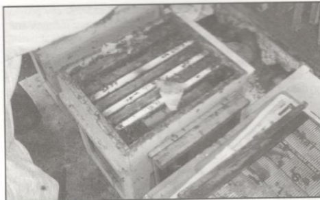
Rajláda elfogadásra beadott tenyészkeretekkel, szélen etetőkerettel

Az expresszdajkás bölcsőnevelés a rajládákban történik. A rajláda minden oldalán, illetve az alján rostaszövetes ablakkal ellátott, amibe 10-12 kg-nyi, többnyire fiatal dajkaméhet fűjnek. A ládába 9 keret állítható. A méhek összerakása után széltre beteszik az etetőkeretet, majd egy-egy keretnyi helyet kihagyva, beraknak 4 mézes keretet, (ha fedett, felkarcolják). Az etetőt feltöltik, tetejére lepényt tesznek. Ezt a munkát az álcázás előtt egy nappal végzik el,