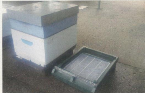
Műanyag kaptáralj tesztelése 2016 novemberében, Új-Zélandon

készült kaptáraljjal. Az új-zélandi klimatikus környezeti feltételek - rengeteg csapadék ősszel és tavasszal -, a szállítás közbeni erős igénybevétel és abból adódó mechanikai sérülések, a méhegészségügyi problémákból eredő (itt a nyúlásra gondolok) költséges kaptáregetés, mind a fa, mint kaptár alapvető alapanyaga ellen szólnak. Elmondása szerint a fejébe vette, hogy megpróbál minden, a világon fellelhető és kereskedelmi forgalomban kapható műanyag kaptáraljából mintát beszerezni és tesztelni őket. Azért a műanyagra esett a választása, mint lehetséges kaptárelem alapanyagra, mert a műanyagból készült kaptáralj tartós, lényegesen könnyebb súlyú, nem igényel festést, könnyen lehet tisztítani, fertőtle-