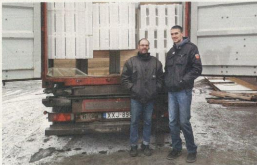
Útra kész az első aljdeszkákkal teli konténer

Hazatérvén Magyarországra, pár hét múlva csörgött a telefonom. Egy jó barátom hívott, kérdezte, hogy volna-e kedvem megismerkedni egy kis céggel a közeli kisvárosban ( www.apitec.hu ). A segítségemre, tanácsomra lenne szükségük. Az autóban ülve aztán elmesélte nagyjából a kis vállalkozás történetét. Amint kiértünk a cég telephelyére és elmondták, hogy miről is lenne szó, rögtön felvillanyozódtam. Kiderült ugyanis, hogy ez a cég rotációs eljárással készülő műanyag kaptárgyártással foglalkozik, de nehézségeik vannak a belföldi értékesítéssel, ezért szeretnének külföldi piacok felé nyitni. Arra gondoltak, hogy esetleg a külföldi